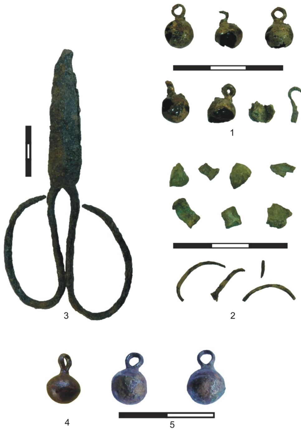
Fig. 4. Inventarul mormintelor cercetate în anul 2012, în care s-au descoperit monede: 1 (M 4), 2-4 (M 6), 5 (M 26).