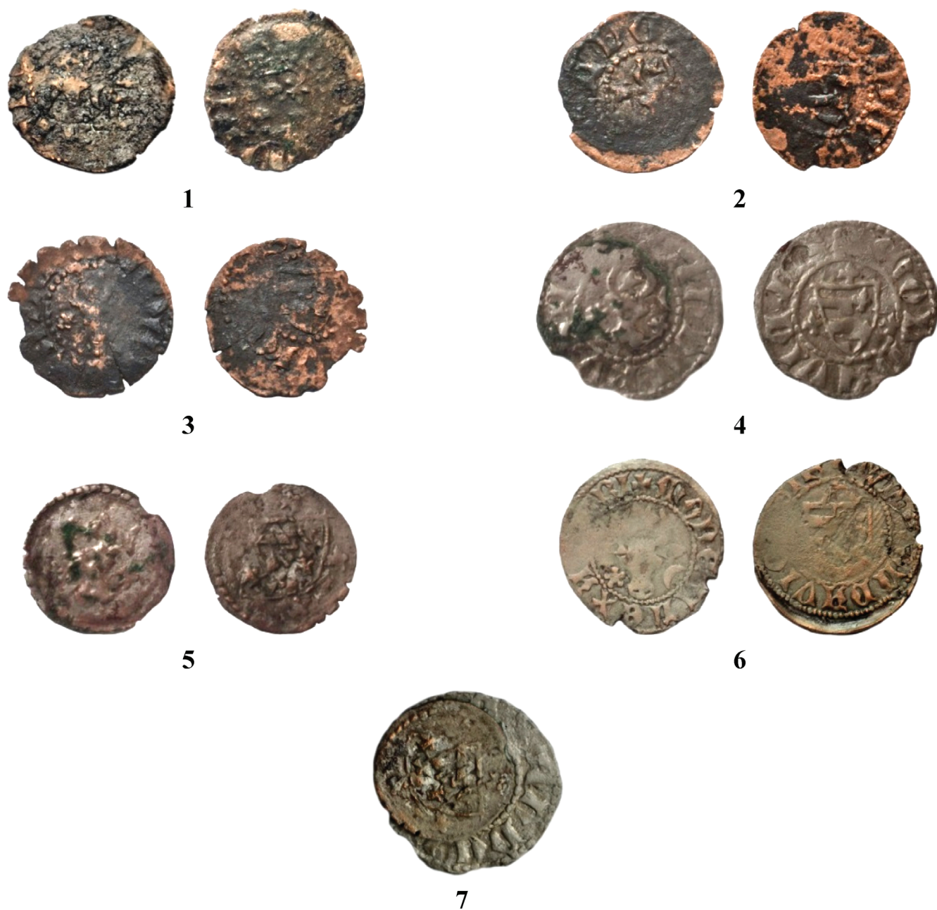
Fig. 3. Monede descoperite în cimitirul de la Piatra-Neamț, cartierul Dărmănești (mărite).

Av. Cap de bour din față, cu o stea cu cinci raze între coarne; din bot iese, spre stânga, un lujer cu floare de crin, deasupra căruia se află o semilună; la dreapta o roză cu șase globule (?).