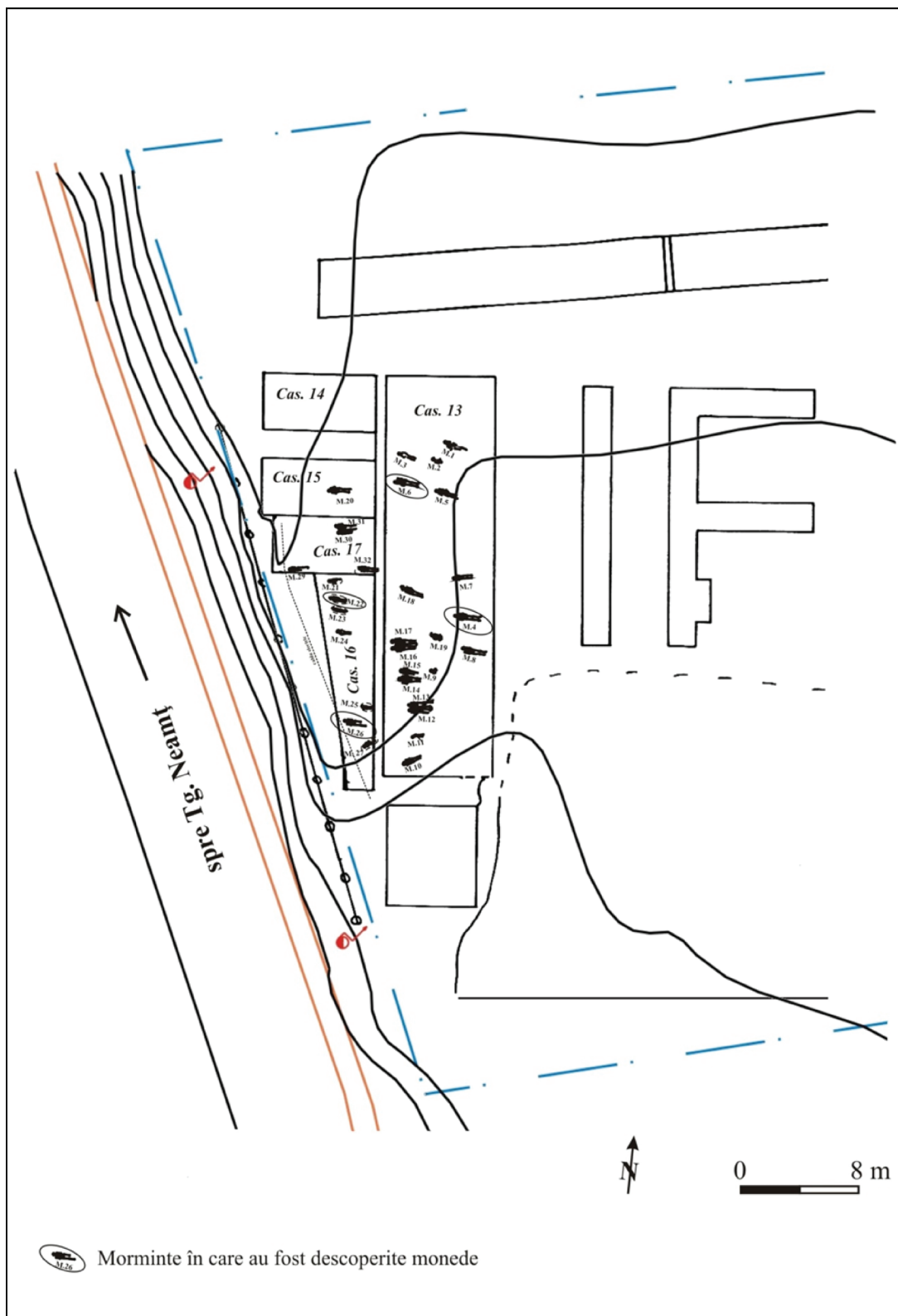
Fig. 2. Dispunerea mormintelor descoperite în campania din anul 2012.