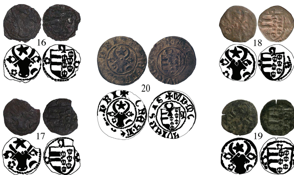
Pl. VI. Monede moldovenești de la Alexandru I (mărite).

E%D0%B2%D0%B0%D1%82%D1%8C-%D0%B4%D0%B2%D0%B0-%D0%BF%D0%BE%D0%BB%D1%83%D0%B3%D1%80%D0%BE%D1%88%D0%B0-%D0%B8-%D0%BE%D0%B4%D0%B8%D0%BD-%D0%B3/ (vizitat la 18.11.2012, exemplar nr. 2).