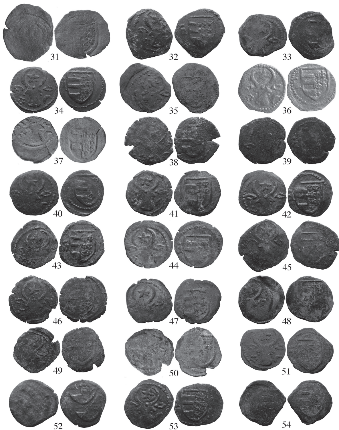
Pl. III. Monede medievale descoperite la Răzeni (mărite).