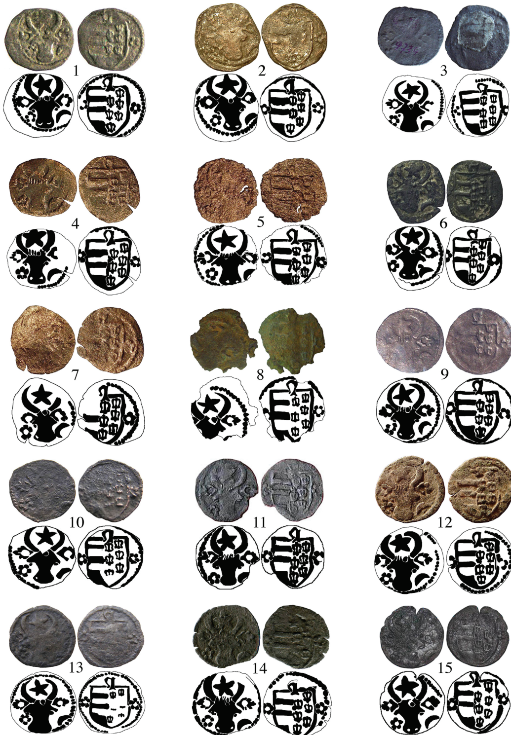
Pl. V. Jumătăți de gros moldovenești de la Alexandru I (mărite).