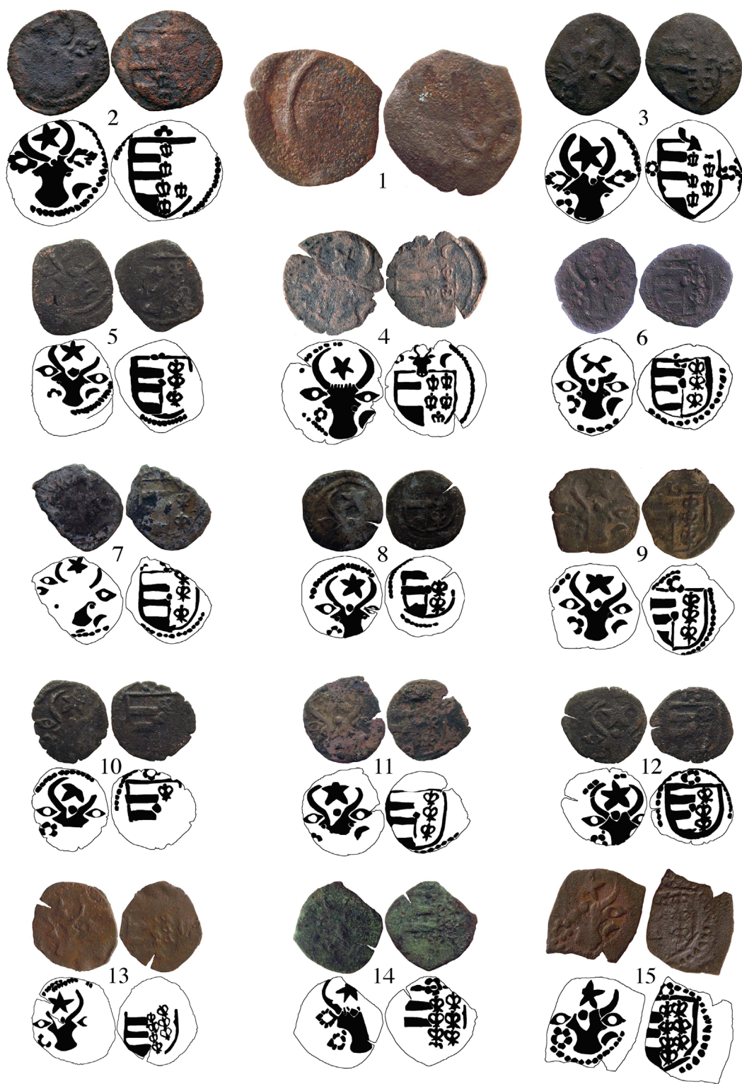
Pl. I. Monede medievale descoperite la Răzeni (mărite).