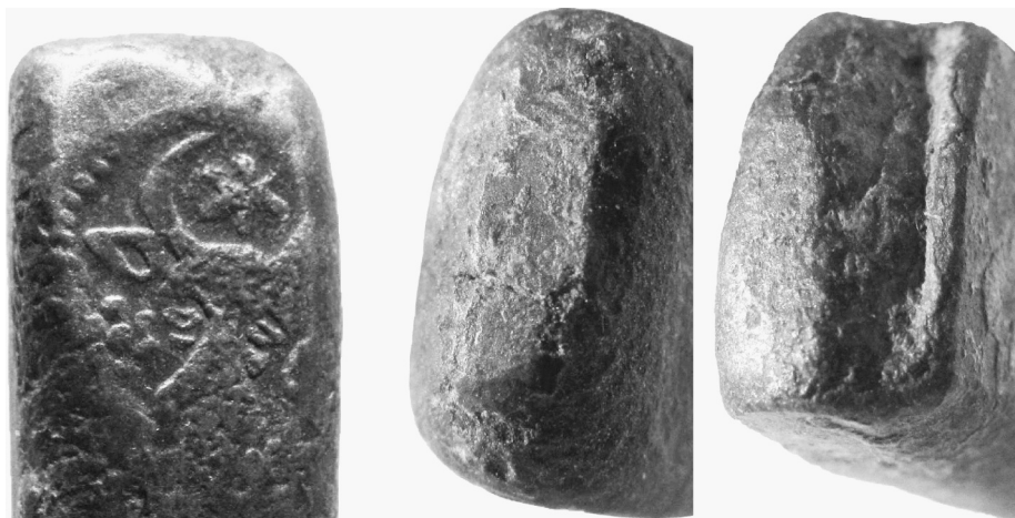
Fig. 2. Marcajul cu cap de bour și extremitățile etalonului cu urme de pilire.

Ușoara deformare a piesei prin aplicarea marcajului a fost corectată prin pilirea ambelor capete (fig. 2). Acest procedeu, împreună cu materialul din care este confecționat etalonul (prea scump în epocă pentru a fi vorba de un produs de serie) și faptul că marcajul a fost aplicat doar o dată, arată că nu poate fi o piesă distribuită unui utilizator oarecare, ci un etalon ușor de transportat și depozitat, folosit de autorități pentru a controla unitățile de măsură din teritoriu și pentru a confecționa, cel mai probabil din lemn, etaloane pentru principalele unități de măsură (palma și multiplii acesteia, cum ar fi pasul – 6 palme, stângenul – 8 palme, sau prăjina – de la 16 la 24 palme), pentru a fi distribuite diverșilor utilizatori.