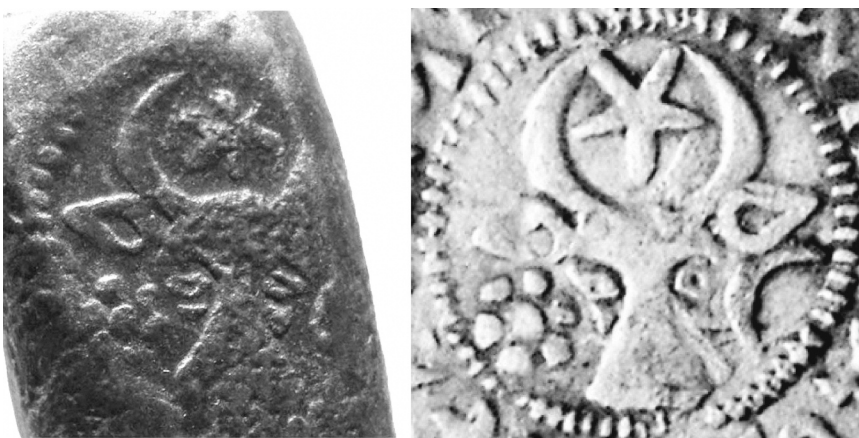
Fig. 4. Capul de bour figurat pe etalon și pe o monedă de la Bogdan III din tezaurul de la Săseni, raionul Călărași, Republica Moldova.

numărul plângerilor și proceselor provocate de folosirea de etaloane „mincinoase”, pentru controlul prețurilor și taxelor, pentru produsele evaluate cu măsuri de lungime și, probabil, pentru armonizarea propriului sistem de măsuri cu cele ale principalilor parteneri comerciali ai principatului.