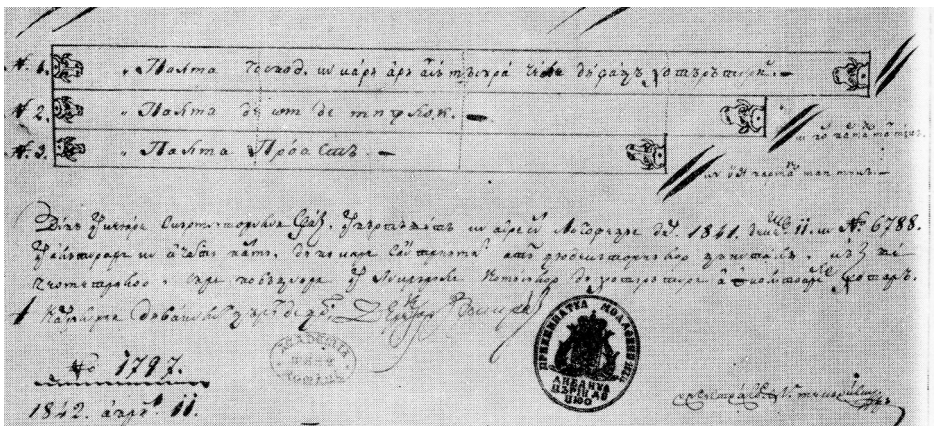
Fig. 3. Cele trei categorii de palme moldovenesti într-un document din 1842 (după N. Stoicescu).