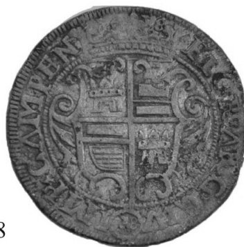
Pl. III. Monede din tezaurul descoperit la Constantin Brâncoveanu, jud. Călărași.