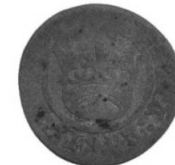
Pl. II. Monede din tezaurul descoperit la Constantin Brâncoveanu, jud. Călărași.