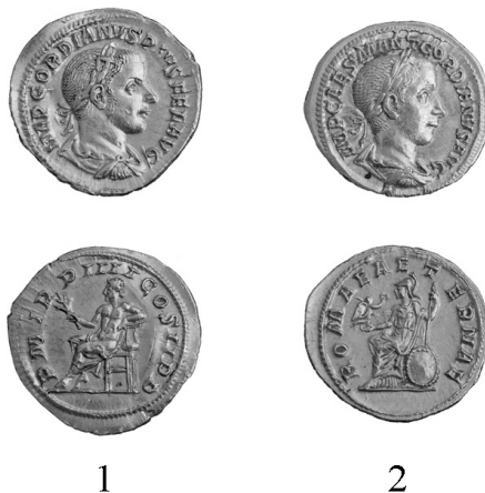
Fig. 1. Aurei emiși de Gordian al III-lea din tezaurul de la Pitești – lotul I.