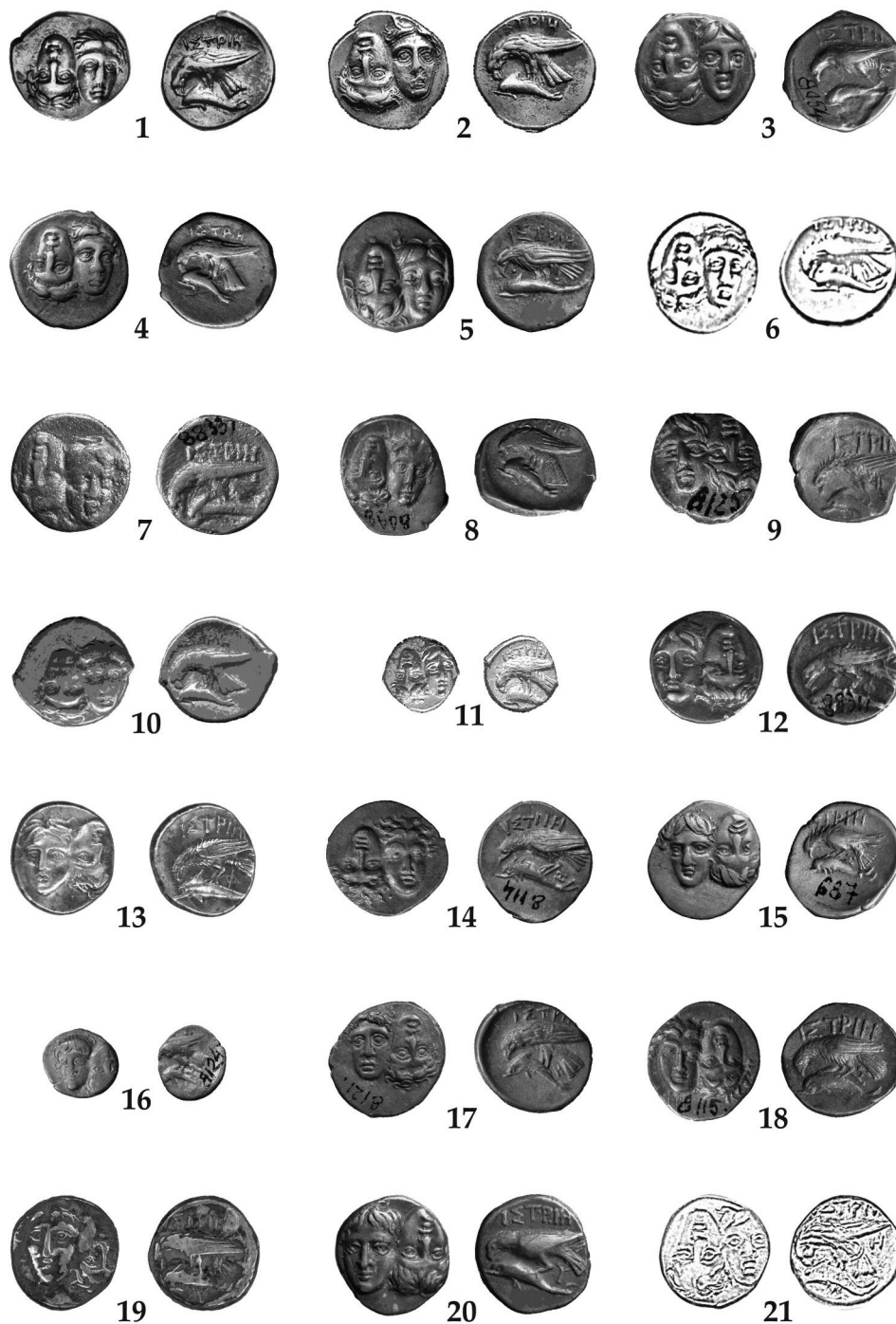
Pl. III. Monede de argint de tip Apollon (seriile III și IV) emise în epocă autonomă.