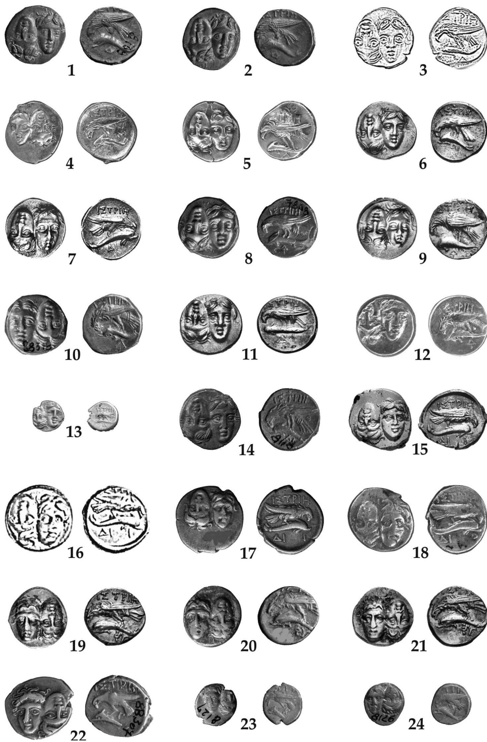
Pl. IV. Monede de argint de tip Apollon (seriile III și IV) emise în epocă autonomă.