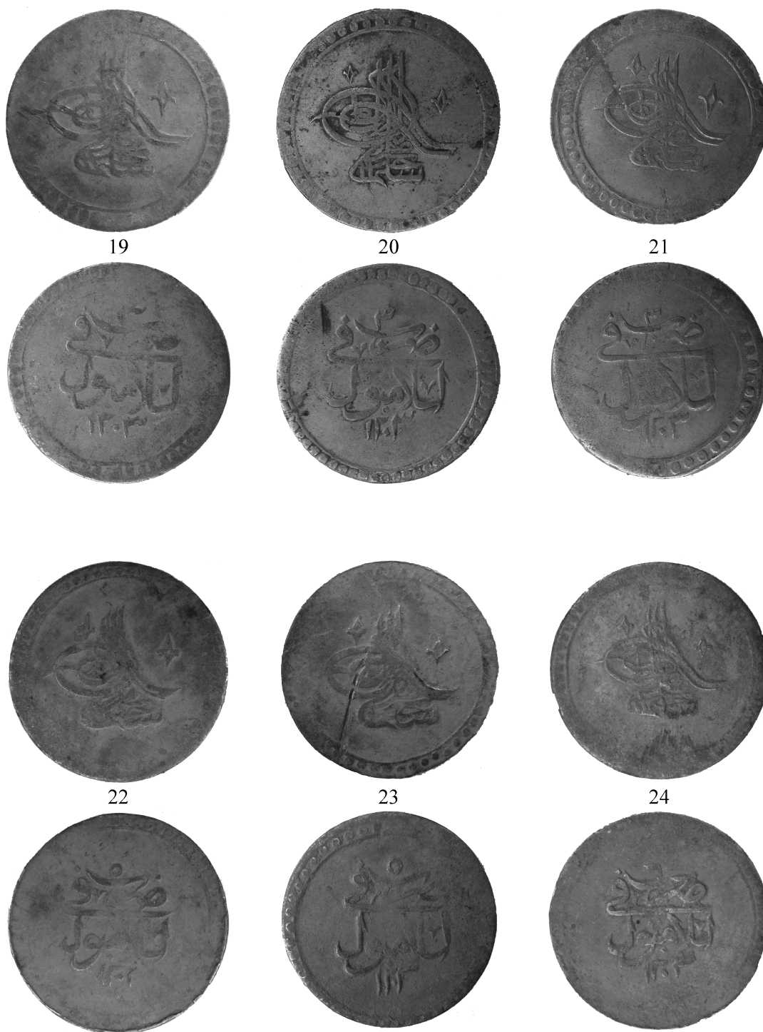
Pl. IV. Monede din tezaurul descoperit la Nișcov.