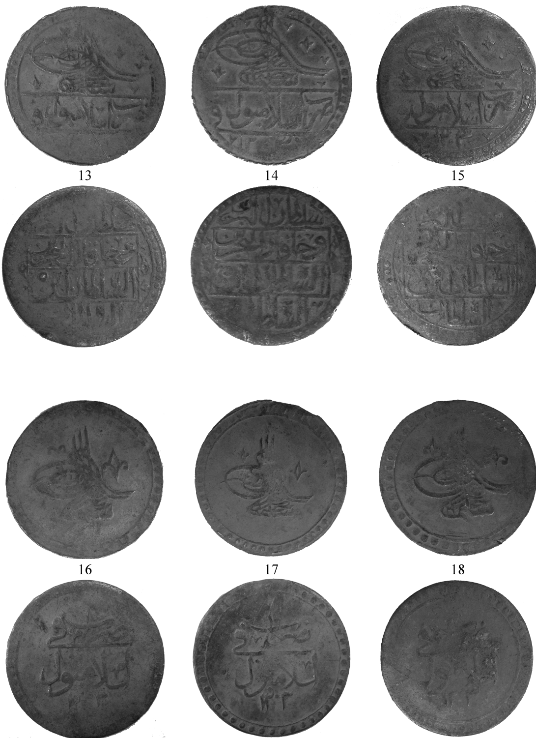
Pl. III. Monede din tezaurul descoperit la Nișcov.