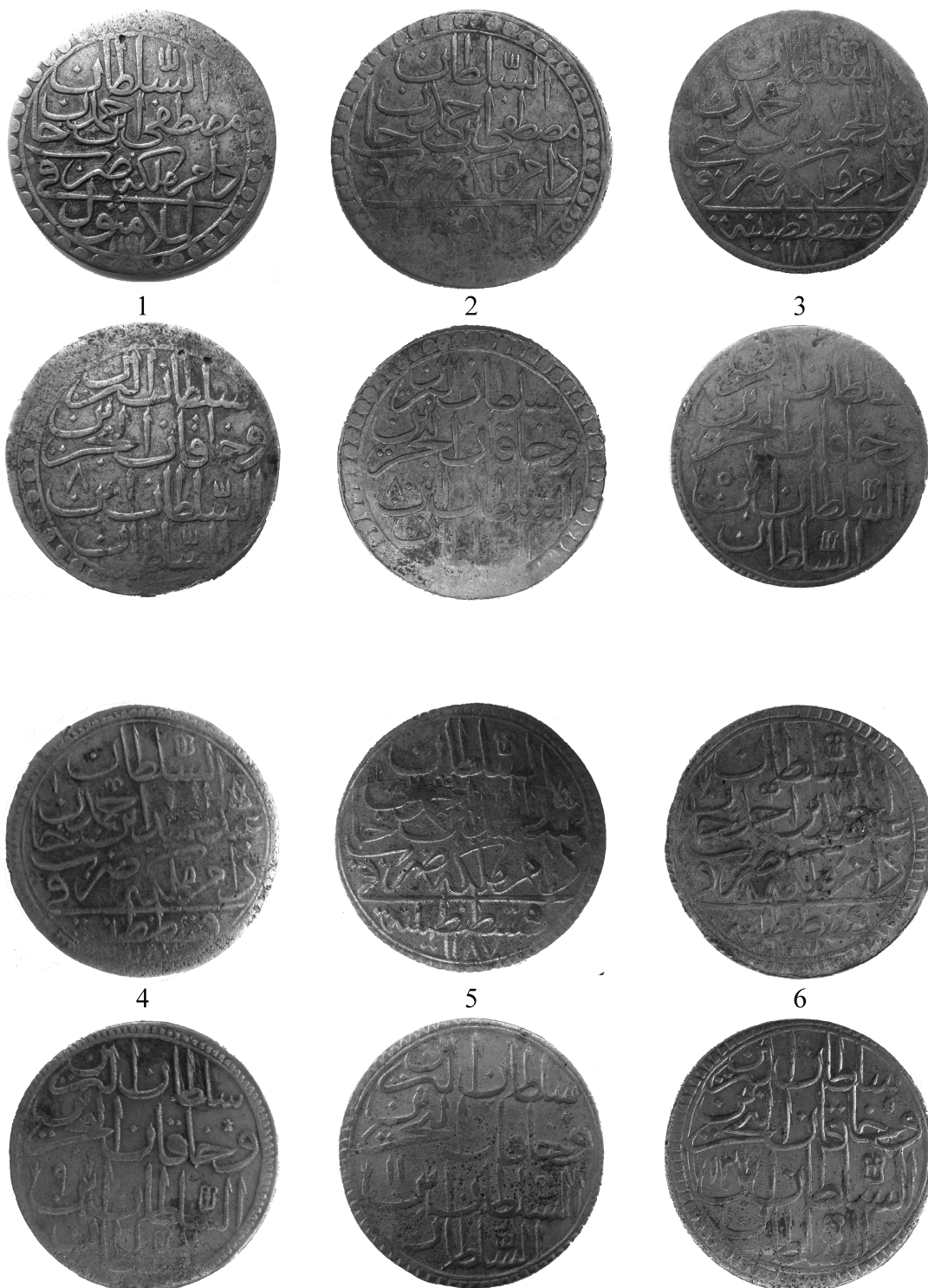
Pl. I. Monede din tezaurul descoperit la Nișcov.